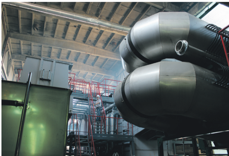
■ Šilutės pl. katilinėje sparčiai statomas naujas biokurą deginsiantis katilas. 2014 metų rudenį jis jau gamins pigesnę šilumą klaipėdiečiams.