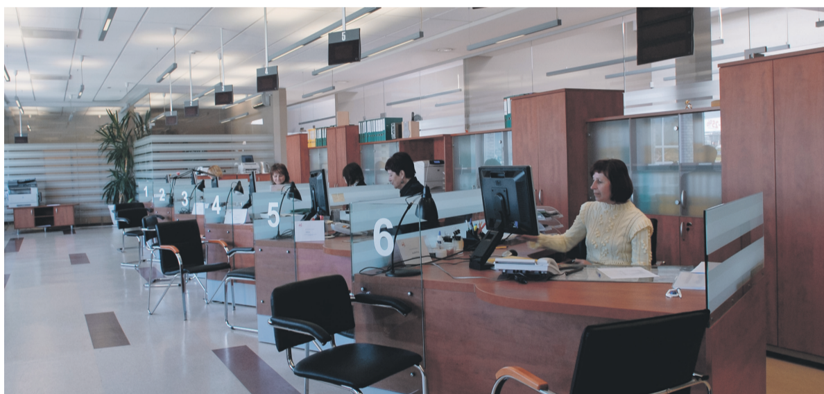
■ Klientų aptarnavimo centras kiekvieną mėnesį paruošia sąskaitas daugiau kaip 50 tūkstančiams klientų.