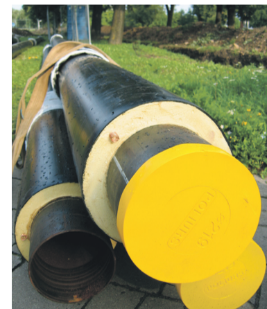
■ Vamzdynai: po Klaipėdos miestą išsirasgės daugiau nei 230 kilometrų ilgio vamzdynų labirintas, kuriuo į mūsų namus atkeliauja šiluma. Atnaujinti 1 kilometrą šilumos trasos kainuoja apie 1 milijoną litų.