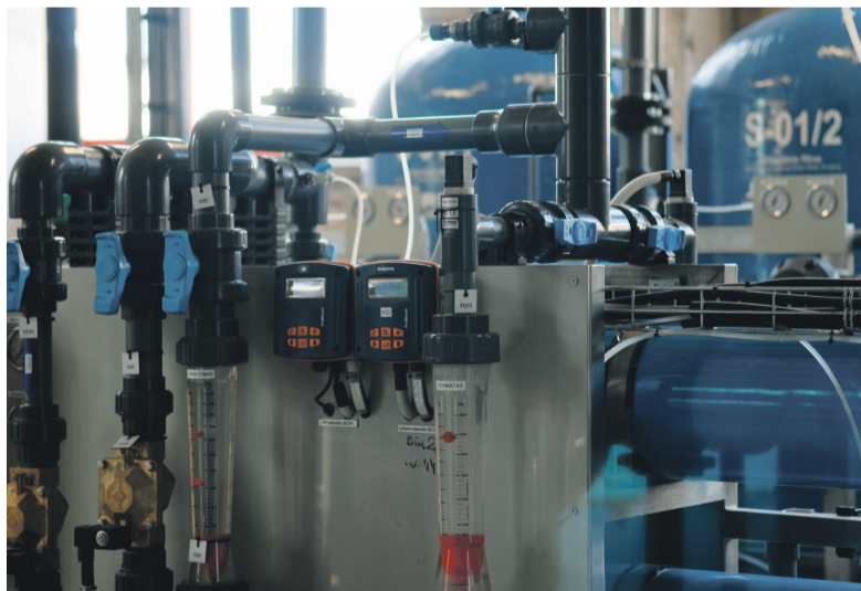
■ Visose bendrovės katilinėse 2012 metais atnaujinti vandens paruošimo cechai – prieš patekdamas į tinklus vanduo specialiai suminkštynamas, kad prailgintų vamzdynų tarnavimo laiką.