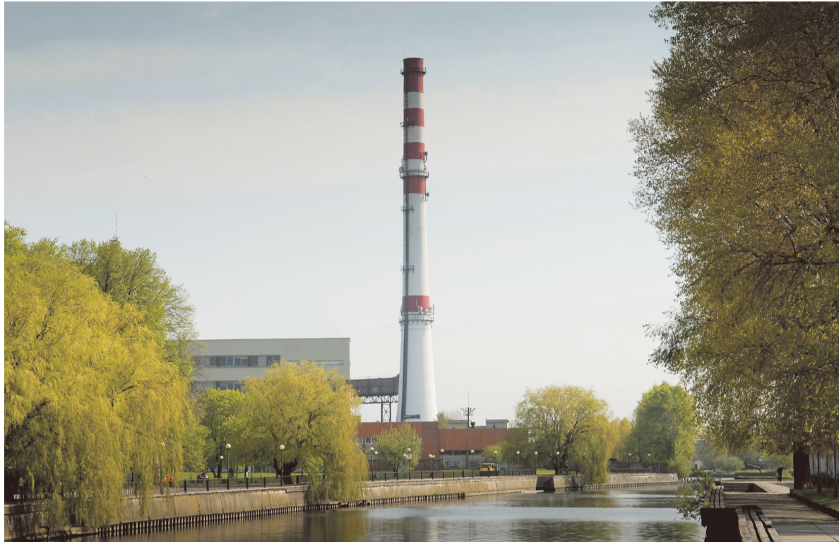
■ Pernai AB „Klaipėdos energija“ visiškai nutraukė elektros gamybą ir šiuo metu gamina šilumą Klaipėdos ir Gargždų miestams bei tiekia garą pramonės įmonėms.

Tai viena seniausių ir didžiausių miesto įmonių, už kurios sienų verda nematomas gyvenimas – gaminama ir tiekama mūsų kasdienio komforto dalis – šiluma. Švėsdami 85-ąjį gimtadienį Klaipėdos energetikai žengia į naują epochą, kurios skiriamasis ženklas – modernios technologijos, atnaujintos trasos, išplėtotas nepriklausomų gamintojų tinklas, šviri šiluma, kuria nenutrūkstamai aprūpinami Klaipėdos ir Gargždų miestai.